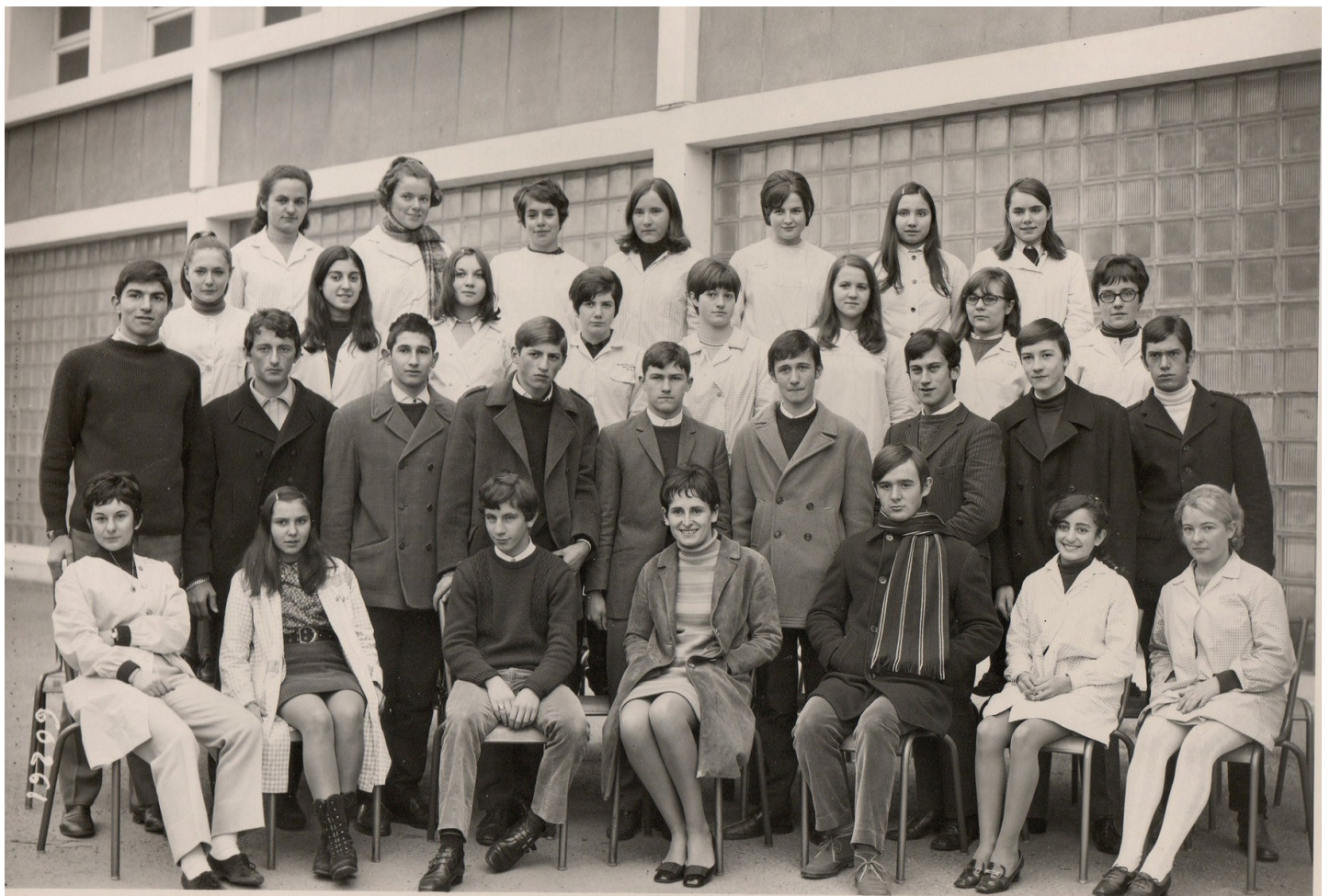
Lycée d'Etat saint Cricq - Bau Année Scolaire 1967-1968