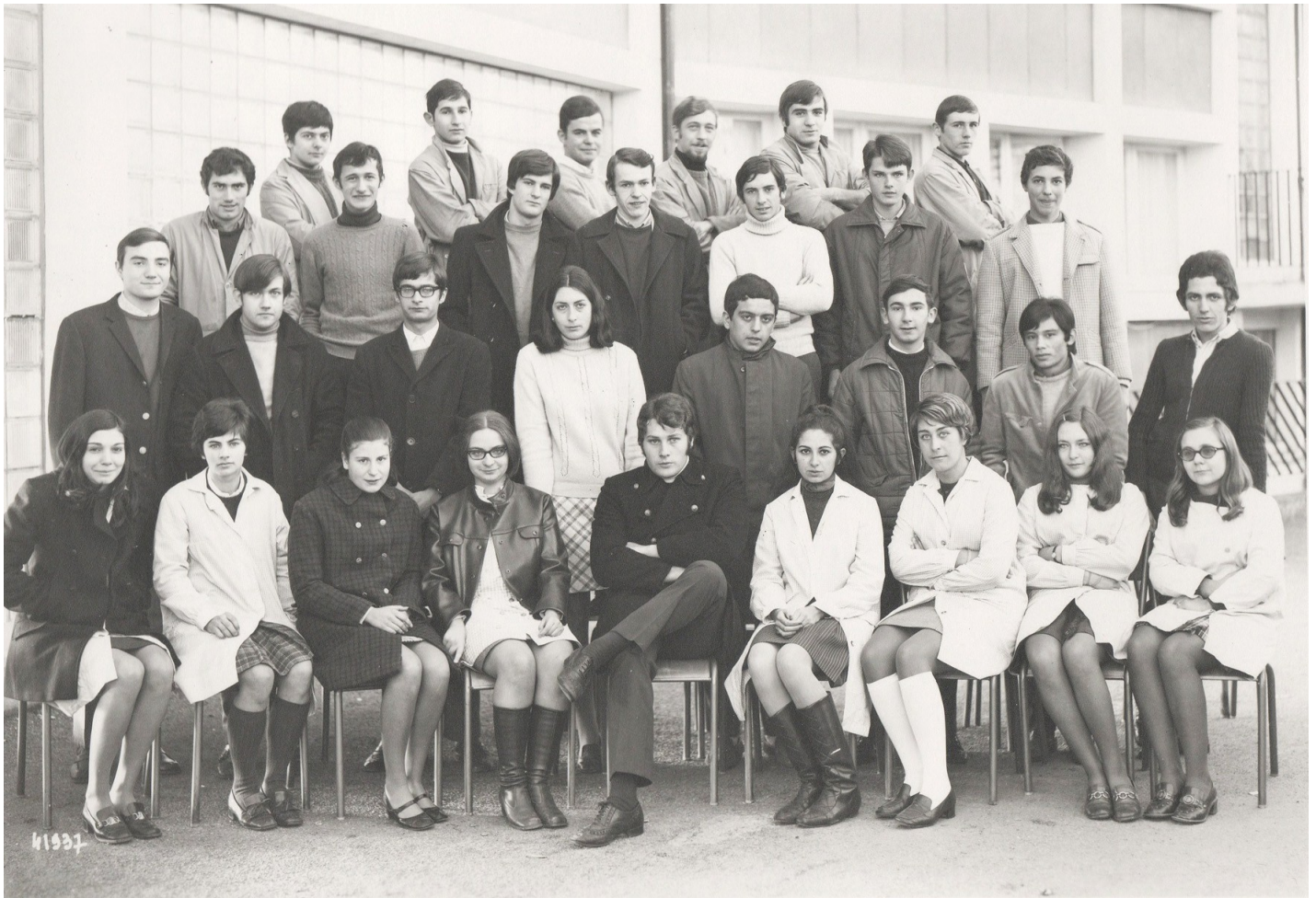
ANNÉE SCOLAIRE 1968 - 1969